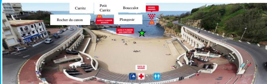
Schéma de la zone de baignade