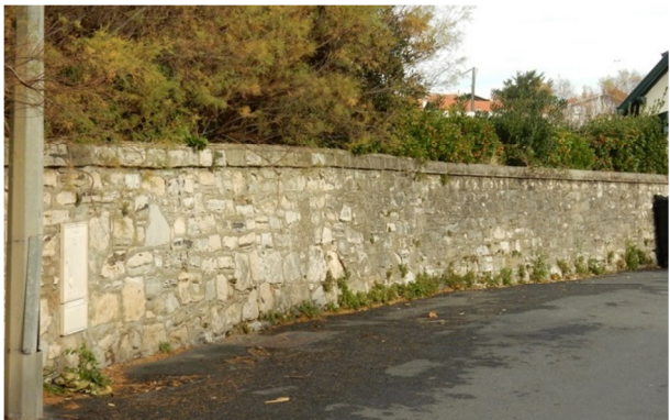
Rue des Falaises Beurivage Mur plein, en pierres moellonnées, toute hauteur et couronnement