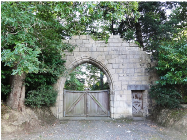
Porche néo-gothique d'un mur plein

Des murs et clôtures font partie du patrimoine exceptionnel. Ils sont constitués soit de murs pleins soit de murs-bahuts surmontés de grilles le plus souvent ouvragées. Le style de certaines clôtures s'identifie au style des immeubles auxquels ils correspondent. Les éléments d'accompagnement font partie de ces clôtures (portails, piliers, grilles d'entrée) ; les clôtures prolongent l'effet d'urbanité.