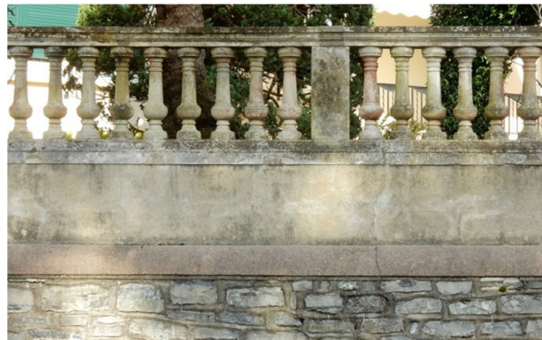
Allées Sapièha, Clôture sur soutènement, surmontée de balustres