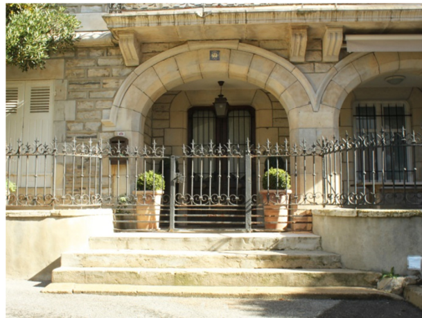
Portail en serrurerie d'un mur bahut ; la transparence de la clôture participe à l'apparat et laisse voir l'architecture