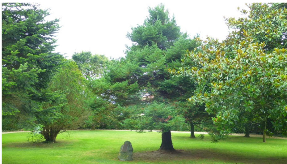
Le parc de la villa Natacha